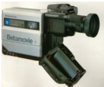
The First Camcorder, 1983

Macam-macam camcorder: miniDV, DVD camcorder, dan digital8.