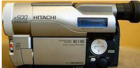
Hitachi Digital8 Camcorder