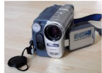
Sony DV Handycam